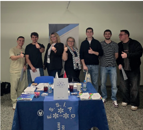
Yaşar Üniversitesi Kariyer Günleri süresince öğrenciler dernek standını ziyaret etti.