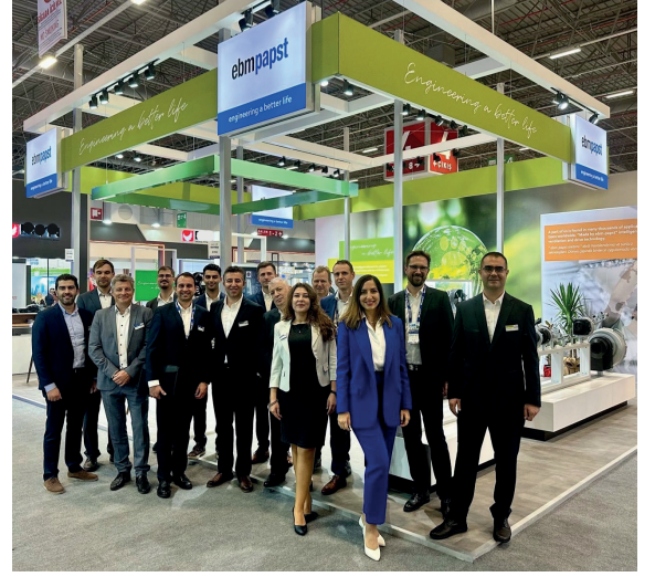
ebmpapst Türkiye Ekibi

AR-GE'ye yapılan sürekli yatırımlar, yüksek aerodinamik verime sahip tasarımlar, akıllı kontrol sistemleri ve dijitalleşme odaklı inovasyon yaklaşımı şirketin sektördeki öncü konumunu güçlendiriyor. Ayrıca güçlü lokal satış ve teknik ekip, geniş stok altyapısı ve çözüm odaklı yaklaşımı sayesinde müşterilere hızlı ve esnek çözümler sunuluyor.